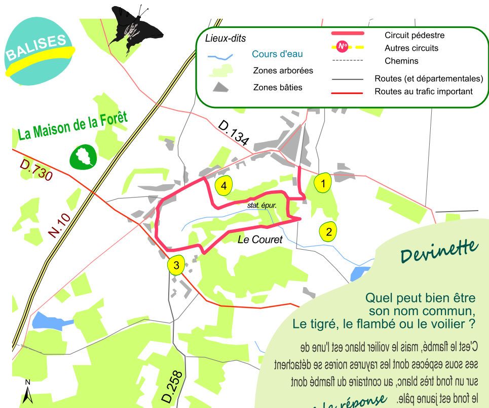
échelle : 1/25 000ème 1cm pour 250 m.